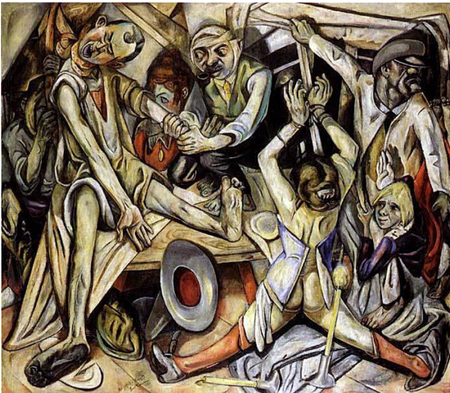
La nuit 1918-1919

Dans ses œuvres, il peindra souvent l'horreur du nazisme. Dans ses tableaux, la scène est représentée comme une scène de théâtre auquel on assiste.