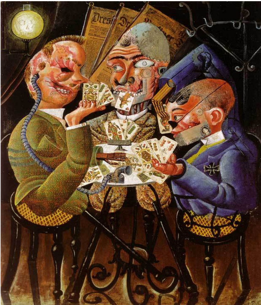
Les joueurs de skat 1920