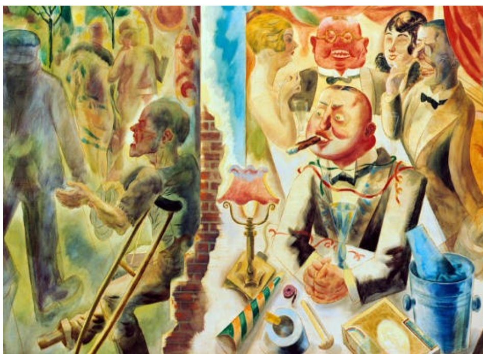
À l'intérieur et à l'extérieur, riches et pauvres 1926

George Grosz (ou Groß): Est né en 1883 à Berlin. Il étudiera lui aussi à l'école des Beaux-Art de Berlin. Il passera deux ans à la guerre où son rôle sera de transporter les prisonniers. En 1915, il tombera gravement malade. Il sera alors hospitalisé pendant plusieurs mois. A sa sortie, il commencera à peindre « l'incroyable laideur de l'Allemagne ». En 1918, il s'intéressera au parti communiste allemand (KDP). Il se fera arrêter pour cela un an plus tard. Il réussira à s'échapper grâce à de faux papiers. C'est à ce moment là qu'il rejoindra les artistes du dadaïsme. Il écrira des articles dans des revues politisées berlinoises comme « Der Blutige Ernst » ou encore « Die Aktion ». Ces revues seront par la suite saisies par la justice et censurées. Dans ces tableaux, il peindra de nombreuses caricatures pour montrer le monde de l'après guerre. Antinazi, il quitte l'Allemagne en 1933 pour s'installer à New-York. Son style redeviendra plus coloré. Ses tableaux ressembleront beaucoup au romantisme sentimental. En 1954, il sera élu à l'Académie Américaine des Arts et Lettres. En 1959, il retournera à Berlin où il y mourra suite à une chute dans les escaliers.